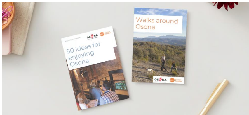
Booklets • Osona Turisme

Aquest mes de juny, a la web d'Osona Turisme, s'ha actualitzat la informació del curs del Bon Coneixedor d'Osona donant-hi més visibilitat i s'ha actualitzat el material dels nostres fullets en anglès.