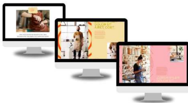
Site d'Osona Artesana

A la sessió també es va presentar la situació de la base de dades d'artesans on s'han recollit informació completa i material gràfic de 46 professionals amb carnet d'artesà professional, la base de dades també inclou informació de 36 professionals sense carnet d'artesà.