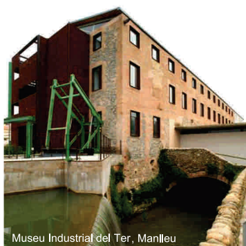
Museu Industrial del Ter, Manlleu