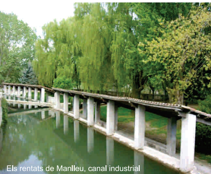
Els rentats de Manlleu, canal industrial