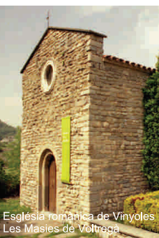
Església romànica de Vinyoles Les Masies de Voltregà