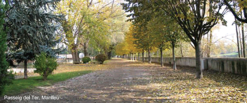
Passeig del Ter, Manlleu