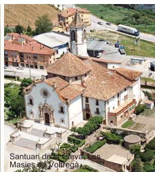
Santuari de la Creu, Les Masies de Voltregà